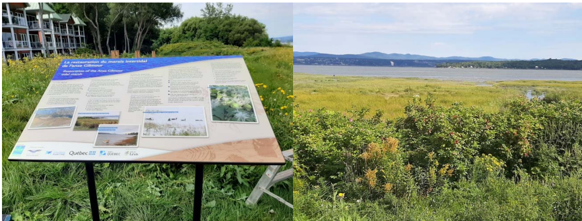
Panneau d'interprétation à l'anse Gilmour à gauche et photo du marais de l'anse Gilmour, à droite