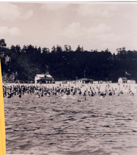
Plage de l'anse au Foulon en 1938