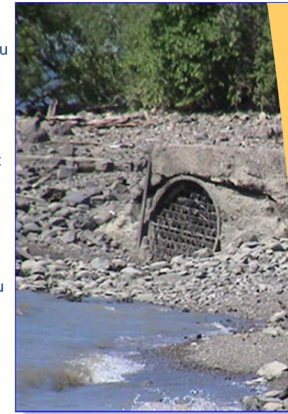
Trop-plein déversant les eaux usées sans traitement en temps de pluie

Seules données publiques disponibles pour la région : Rapports sur la qualité bactériologique de sites potentiels de baignade de 2004 à 2009 du MDELCC. Le Programme a cessé ses opérations en 2010 en attendant la construction de l'usine d'ozonation de Montréal. De nouvelles données publiques sont prévues.)