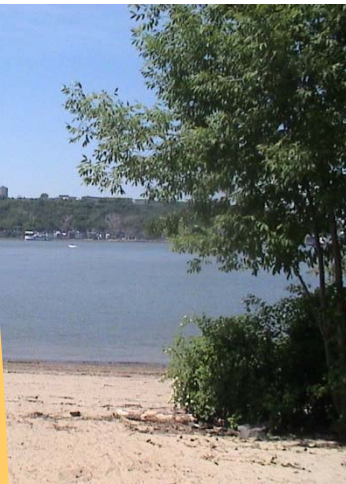
Plage de l'anse Tibbits à Lévis