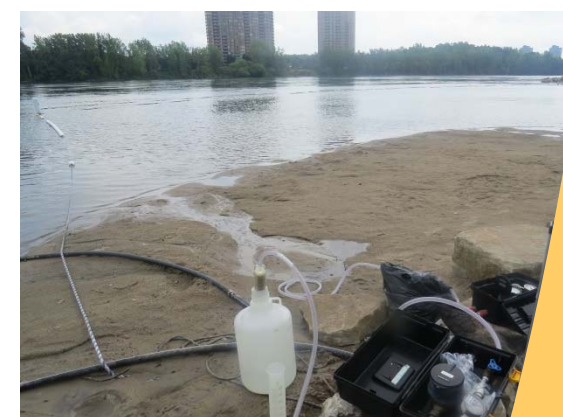
Plage Verdun à Montréal testant un appareil pouvant donner les résultats de la qualité bactériologique de l'eau en 15 minutes

Les rejets de la station d'épuration des eaux usées de Montréal constituent la plus grande source de contamination bactériologique du fleuve. L'impact de ces rejets s'atténue au fil de la distance parcourue. Il diminuera dans quelques années, grâce à la mise en place, à cette station, d'une unité d'ozonation permettant la désinfection des eaux usées.