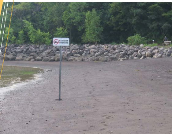
Plage Jacques-Cartier à Québec