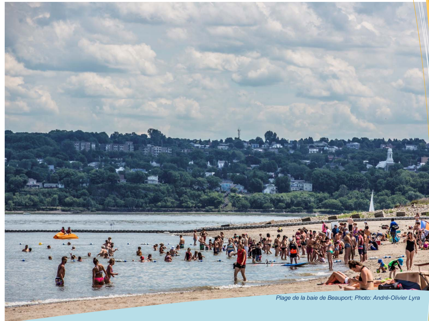
Plage de la baie de Beauport

Et pour redonner le fleuve aux citoyens!